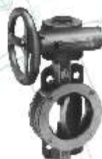
Fig. 605 /606

3" - 20" AWWA Tipo "wafer" AWWA Wafer type