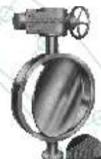
Fig. 603 / 604

3" - 24" Fig. 605 Tipo "wafer" alta pressão Serie 605 Wafer High pressure Fig. 606 com hytherm Serie 606 Wafer Hytherm seal