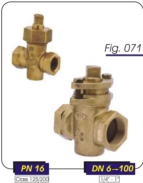
Fig. 071 Válvulas de macho