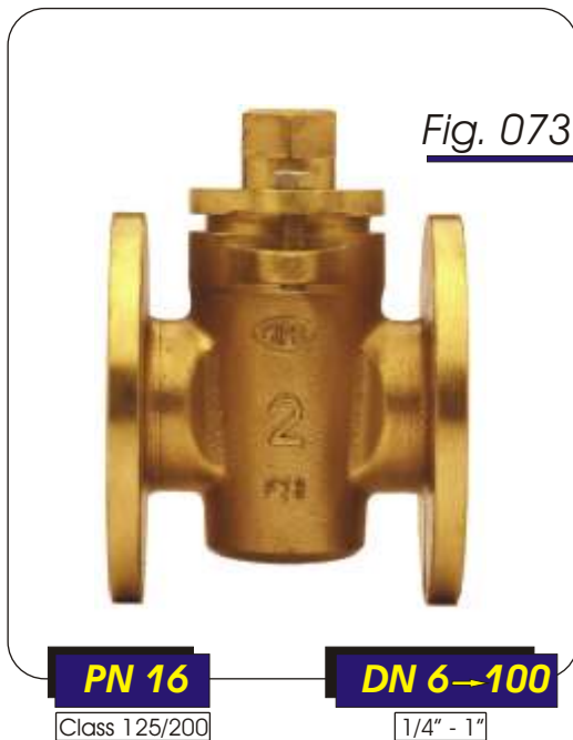
Fig. 073 Válvulas de macho