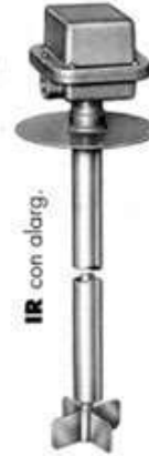
IR con alarg.