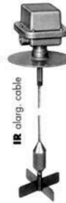
IR alarg. cable