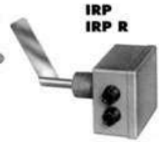
IRP IRP R