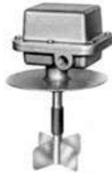
IR Unión flexible 125/180